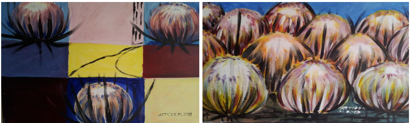
Šentjur, Galerija Zgornji trg, 5. avgust do 5. september 2019, MARIJA ARTIČEK - razstava in poezija